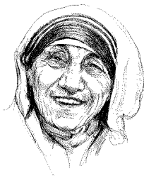
Hl. Mutter Teresa:

Frucht der Stille ist das Gebet. Frucht des Gebetes ist der Glaube. Frucht des Glaubens ist die Liebe. Frucht der Liebe ist das Dienen. Frucht des Dienens ist der Friede.